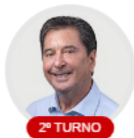
Maguito Vilela MDB

Haverá segundo turno para a escolha do prefeito em Goiânia.