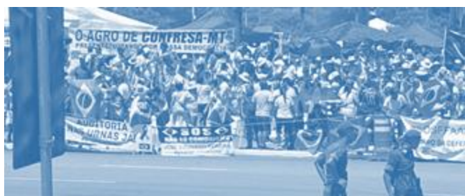
Faixas dos manifestantes em Brasília pedem auditoria nas urnas.

No entanto, apoiadores de Bolsonaro continuam protestando alegando fraude nas eleições mesmo após duas semanas do resultado. O feriado de 15 de novembro, Independência do Brasil, foi mais um pretexto para maiores manifestações nas ruas.